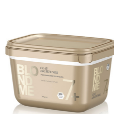
POUDRE BLONDME CLAY 1+2 Schwarzkopf®